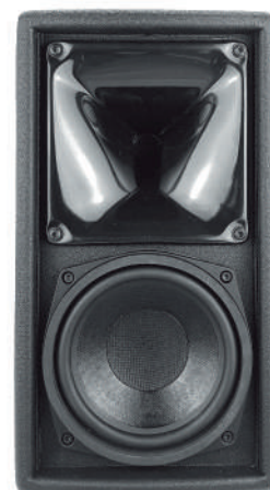
Une fois la grille retirée, le large pavillon PS utilisé avec le haut-parleur d'aigus est visible sur la photo ci-dessus.

La réponse en phase de l'enceinte ePS6 est la réponse signature de NEXO, permettant une compatibilité avec toutes les autres enceintes NEXO (sauf les configurations de retour de scène dont la latence est réduite).